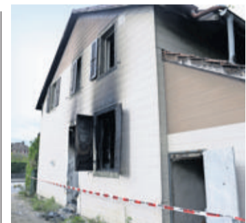
La bâtisse était propriété de la Commune.

Trois occupants illégaux d'une bâtisse de la rue du Midi ont été incommodés par la fumée. L'incendie, survenu jeudi peu avant minuit, a détruit la maison