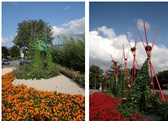
2008 Balade des vertus