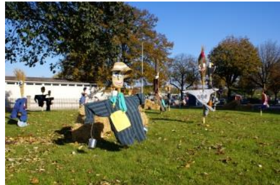
2007 Épouvantails Collaboration avec les écoles