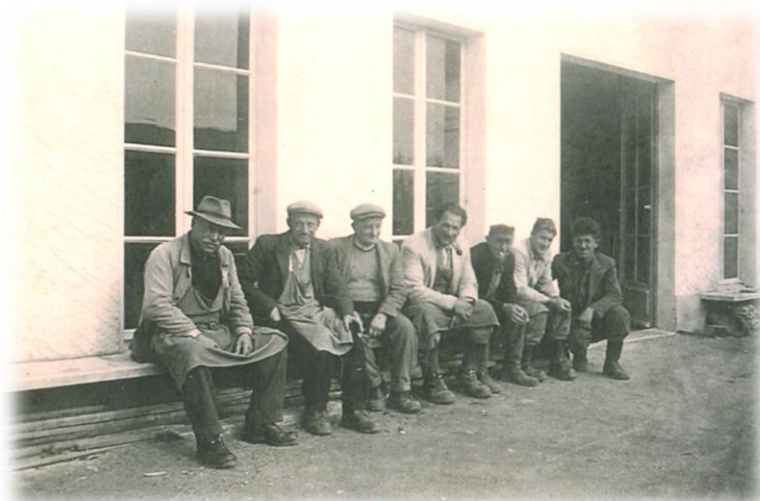
Années 1950 -1960