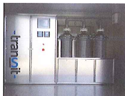
Installation « stripping » (Extraction de l'azote obtenue des eaux putrides)