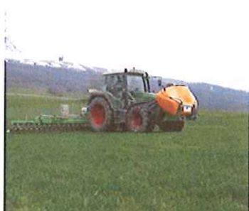
Epandage de Cultan (Azote liquide)

Sur la base de ce constat et des essais en cours, nous avons la possibilité de mettre en place un système intégré à la filière boues de traitement des rejets pour en extraire l'azote et ainsi palier aux charges excessives à traiter pendant le chantier. Cette installation est déjà en fonction dans d'autres villes et s'intègre au système de traitement des boues. Le module est compact, facilement transportable et les résultats que nous avons pu constater sont excellents. S'agissant d'une installation unique en Europe, nous proposons de passer par une phase test d'une année avant de faire l'acquisition de cette installation. La société, qui a mis en place le traitement des boues, va participer à cet essai pilote en partenariat avec la Ville d'Yverdon-les-Bains. Au niveau de la valorisation de l'azote, tout est en place avec un agriculteur de la région et c'est au terme de cet essai pilote, à l'échelle industrielle, extrêmement novateur, que nous pourrions choisir un leasing sur l'équipement ou son acquisition définitive. Cette installation, si elle reste de manière définitive, pourra entrer dans le cadre du subventionnement de la nitrification/dénitrification lors de la réalisation de la STEP 2018