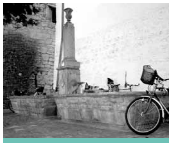
La fontaine du château sur la place Pestalozzi.