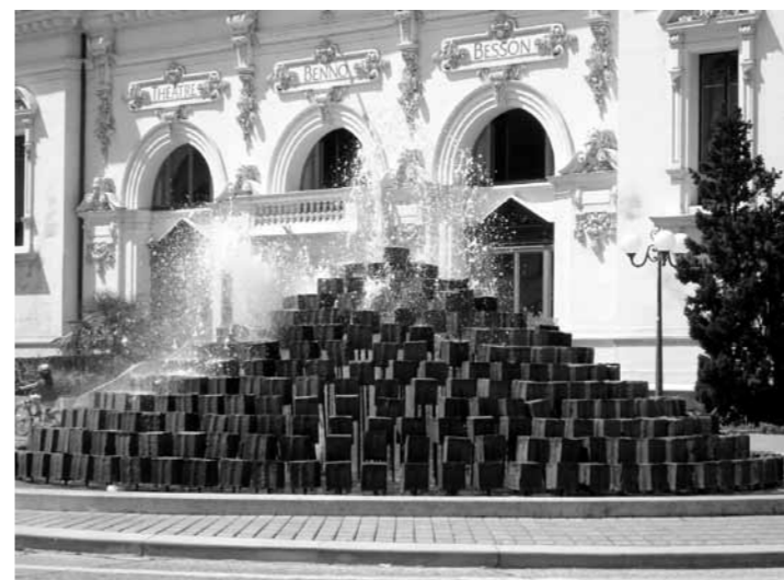
La fontaine «Eau 2000».

L'œuvre évoque «le temps qu'il fait sur le temps qui passe», car elle évolue au fil du temps. L'artiste a déjà remarqué une transformation de sa création, qui ne fait que prolonger la durée de vie de la fontaine: une fine pellicule de calcaire s'est déposée sur les cubes, qu'elle protège en se cristallisant.