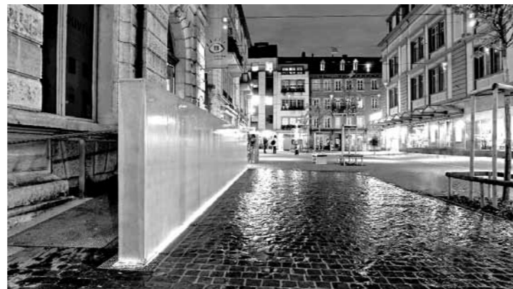
La fontaine de la place de l'Ancienne-Poste, étincelante de nuit. Christoph Lehmann, Yverdon-les-Bains

Le corps principal de la fontaine, un mur en béton teinté bleu, pèse 8 tonnes. Grâce à des rigoles de récupération, une grande partie des quelque 2000 litres d'eau utilisée est réintroduite dans le circuit durant la journée. La nuit, l'eau du bassin tampon est entièrement renouvelée, à la lueur des étoiles lumineuses qui agrémentent l'œuvre.