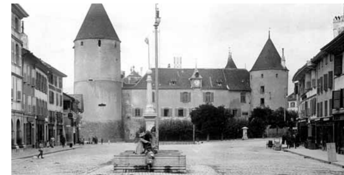
La fontaine de la rue de la Plaine, avant 1904.

Les supports métalliques pour la décoration florale remontent à 1909. La girouette est restaurée près d'un siècle plus tard, en 2002.