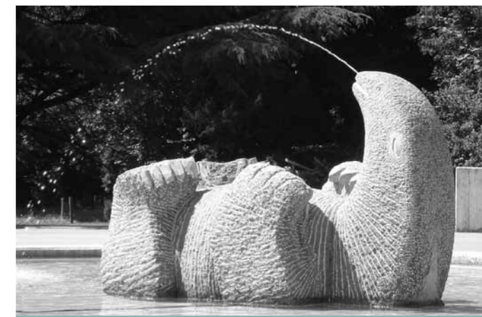
La fontaine «Le grand baigneur».

Afin que l'eau sorte par la bouche du «baigneur», le sculpteur a dû percer la pierre depuis le haut et le bas, de sorte que les deux ouvertures se rejoignent: un travail difficile, en raison de la courbe à suivre et des risques d'éclatement du matériau.