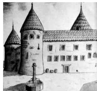
La fontaine de la place Pestalozzi à son ancien emplacement et le château, juillet 1810. Dessin de J.-J. Sigrist, élève de Pestalozzi. Centre de documentation et de recherche Pestalozzi

La fontaine, classée monument historique en 1955, est aujourd'hui exempte d'eau car fissurée.