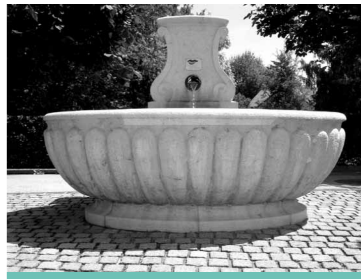
La fontaine du Pollet.

En 1952, le Conseil communal accepte que la fontaine du Pollet soit désaffectée: elle n'est plus correctement alimentée et devient superflue, le quartier de Clendy disposant de deux fontaines publiques (n° 18 et 34). Le bassin en forme de coquille Saint-Jacques est ôté l'année suivante. Il est réinstallé, peut-être après une restauration, au carrefour des 4-Marronniers. Actuellement, l'eau de cette fontaine est potable et d'excellente qualité!